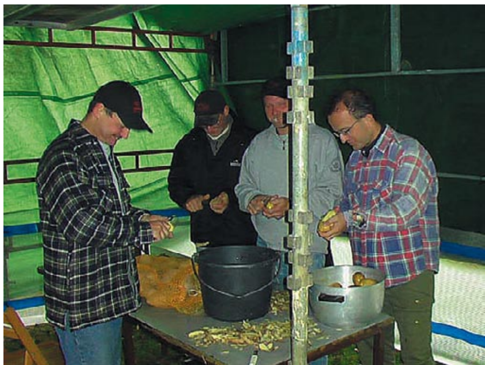
Fynsmesterskaberne i kartoffel skrælning