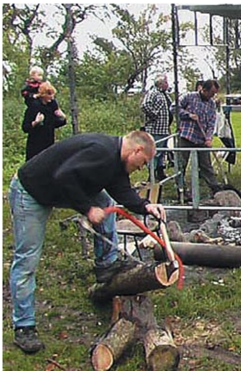
Effektivt: kløvning og savning samtidig!

Jeg vil godt sige mange tak for et godt DSK arrangement, og det bliver ikke sidste gang, jeg kommer til sidevognstræf under broen.