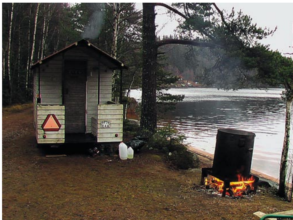
Det er så den transportable sauna

vanen tro blev modtaget med håndtryk af Matti, træffets midtpunkt og organisator.