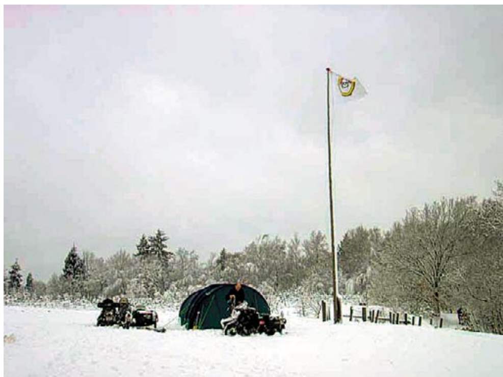
MC Højbjerg holder fanen højt ved Det internationale Gudenåtræf.

MC Højbjerg · Jegstrupvej 67 · 8361 Hasselager · Tlf. 8629 5139 · mail@mchojbjerg.dk