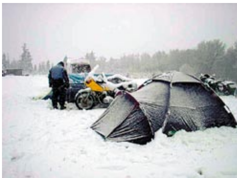
12-2 kl 15,51