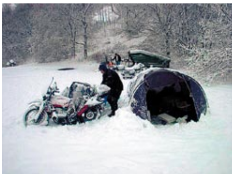
13-2 kl 08,56