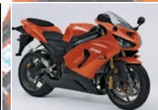
Kawasaki Ninja ZX-6R