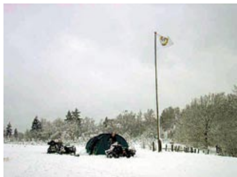
13-2 kl 11,29