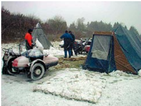
12-2 kl 11,49

I må have de rigtige forbindelser til vejrguderne.