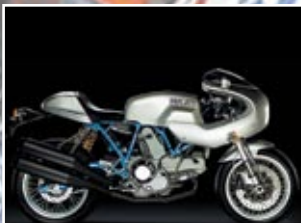
Ducati Paul Smart