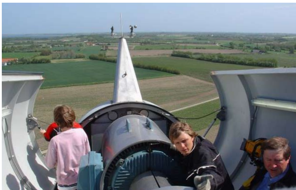
Flot udsigt i 50 meters højde