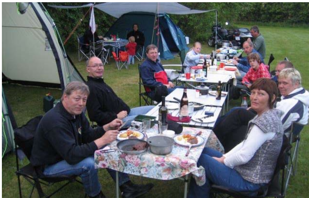
MC Højbjerg Grill langbord

for deres sæson men toiletterne var da åbne. Der blæste en vældig vind over øen medens vi var der, men da der var frit valg på alle hylder/pladser kunne vi udvælge os et lækkert hjørne med dejligt læ. Her kunne vi sidde i t-shirt og klipklapper, men bare vi skulle på toilettet var det med at få det vindtætte og varme tøj på. En del af den dejlige læ stammede fra en stor jordbunke anbragt midt på campingpladsen. Den viste sig dog meget egnet som udkigspost, især ved solnedgang var