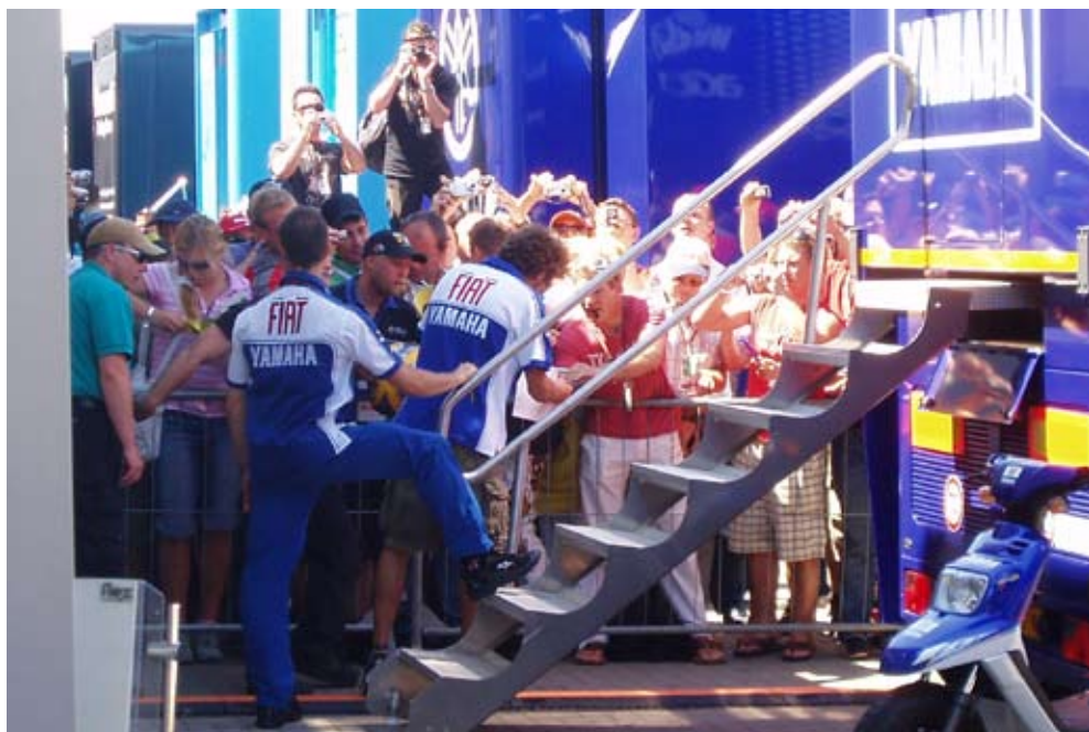
Rossi skriver autofrafer.