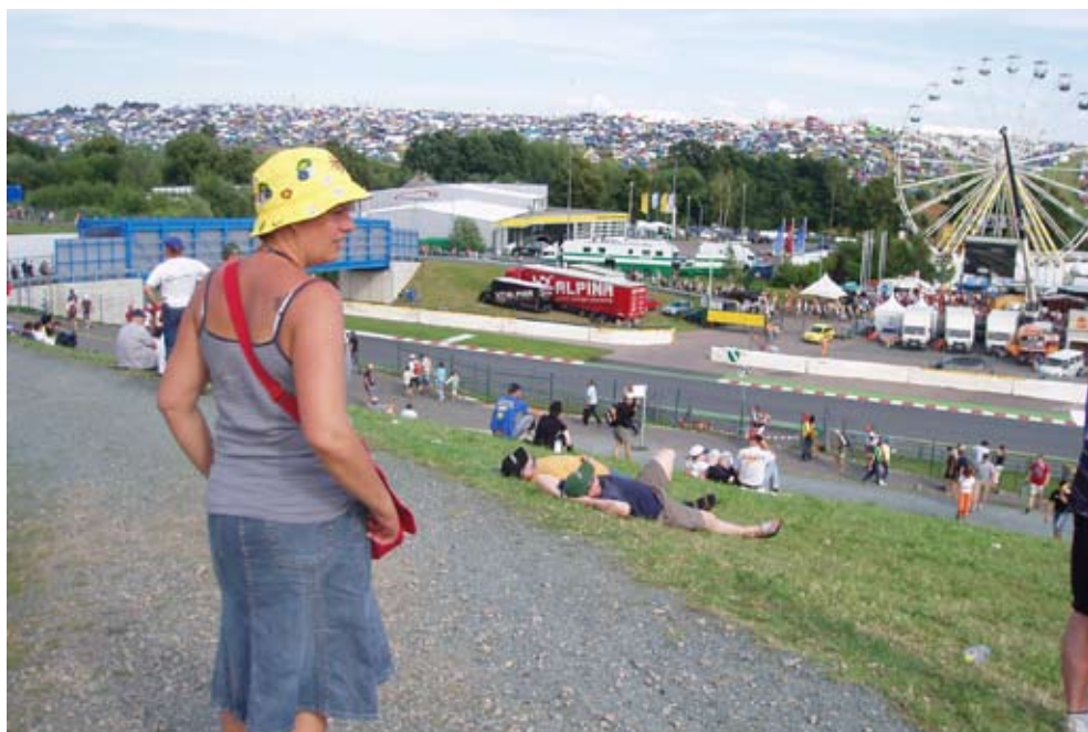
Den store campingplads.