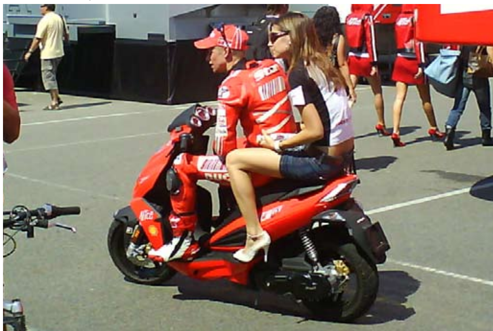
Stoner og Frue.