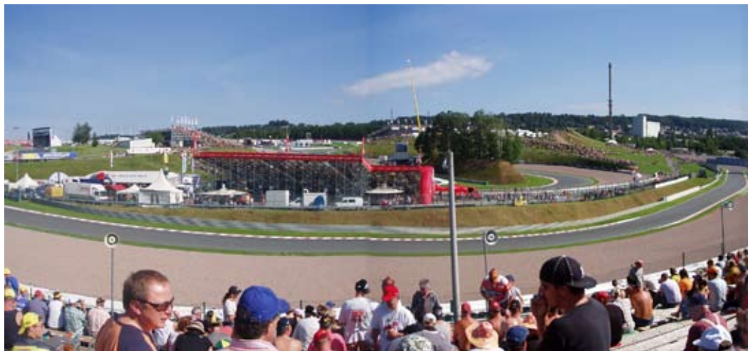
Panorama over banen.