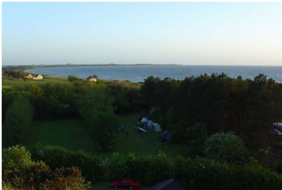
Udsigt mod Sælvig